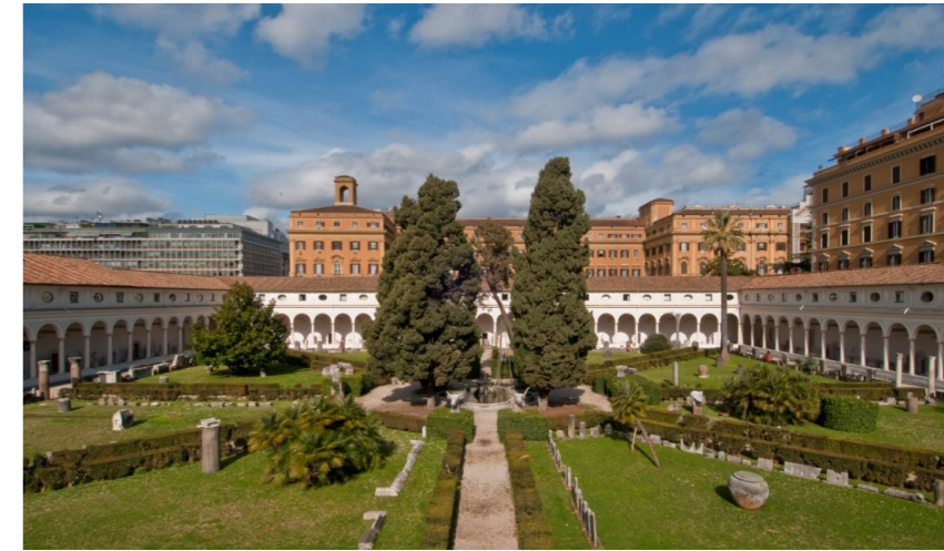
Chiostro di Michelangelo