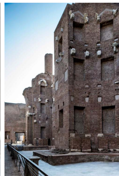
"Natatio", piscina monumentale delle Terme di Diocleziano